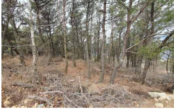
숲가꾸기사업 필요 대상지 전경