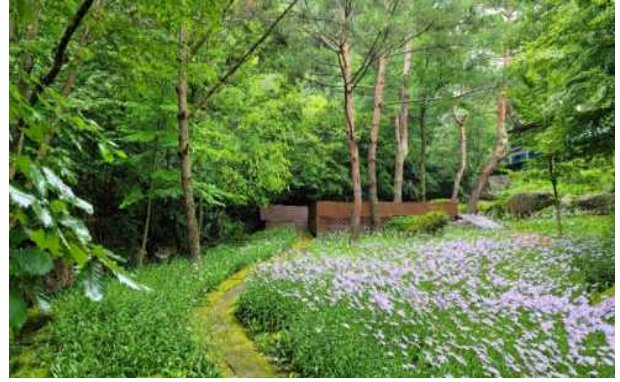
숲속 내 화초류 조성예시