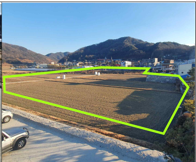
마리면 말흘리 220-1, 220-2