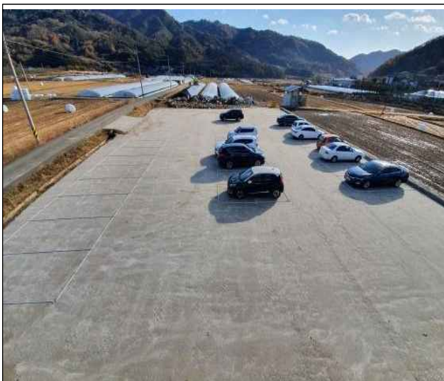
마리면 말흘리 245 (공용주차장 조성)