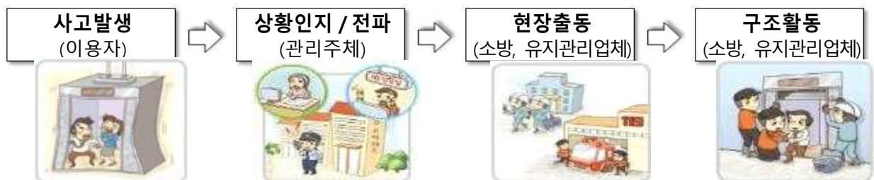
< 승강기 사고대응 합동훈련 흐름도 >