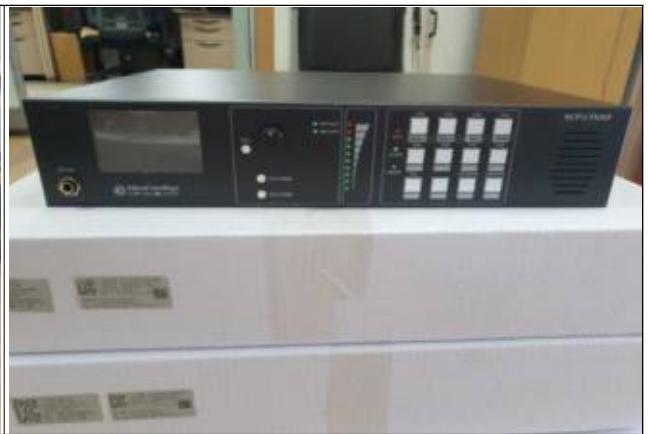
신규 IP기반의 단말기