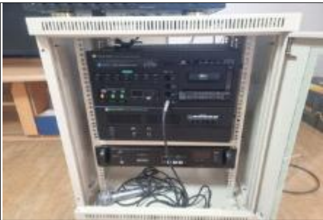
기존 CDMA기반의 단말기