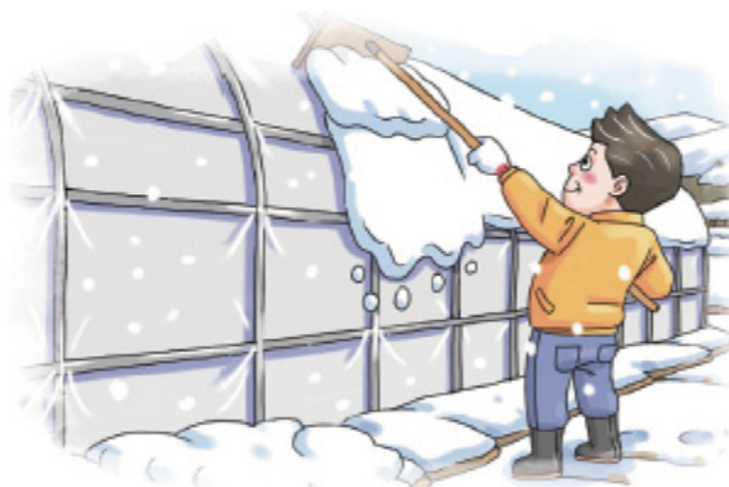
▲ 하우스 위 눈 쓸어 내기