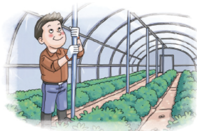
▲ 노후화된 시설 등은 보강지주 설치