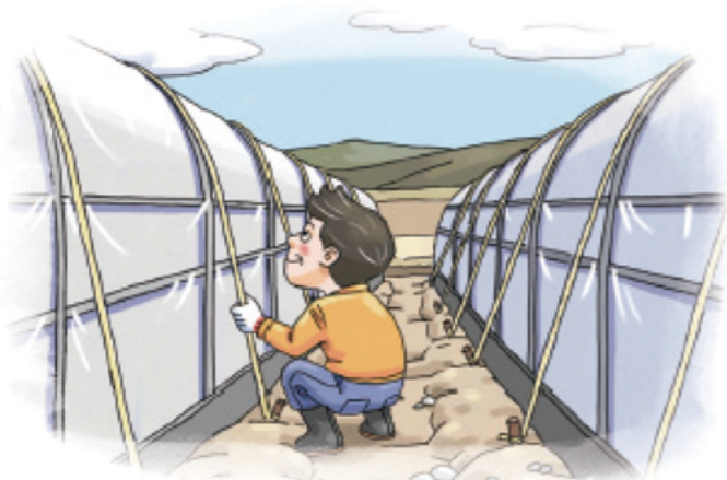
▲ 시설하우스 고정끈 설치 및 보강