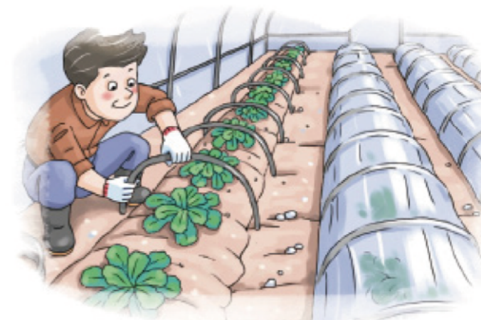
▲ 시설파손, 저온피해 우려시 소형터널 설치