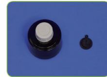
정화통 · 흡입막 · 배기막