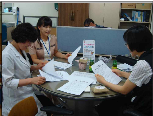
의료기관 관계자 교육