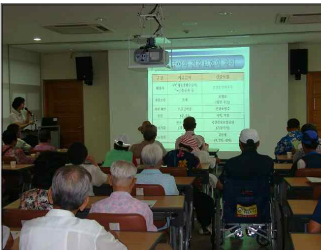
신규수급자 의료급여제도 교육