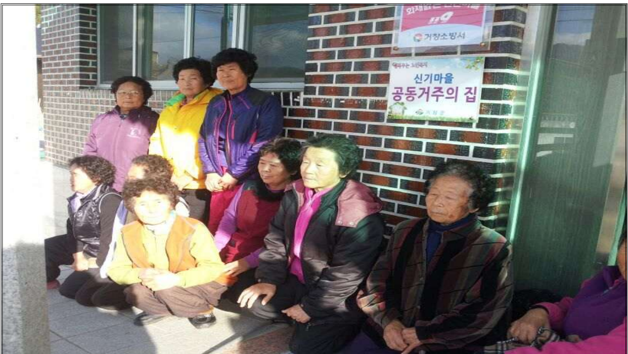
2013년 독거노인 공동거주시설 신기마을 개소식