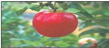
아리수, 씬머킹, 루비에스 등