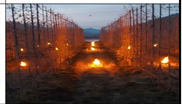
편리하고 오래가는 따스따스