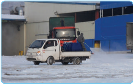
| 도축시설 주변 소독