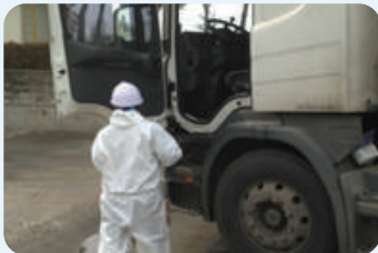
| 차량 내부 소독