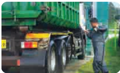
| 차량 외부 소독