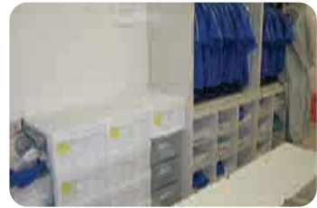
①, ② 위생복 착용