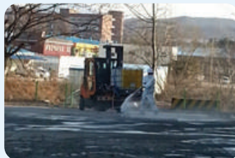
| 공장 내부 소독