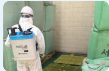
| 공장 내부 소독