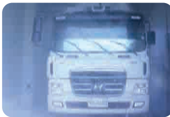
차량 외부 소독