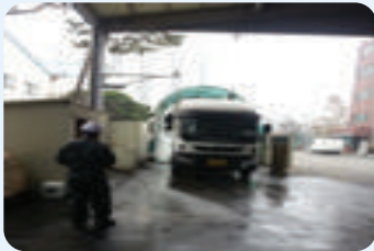
| 차량 외부 2차소독