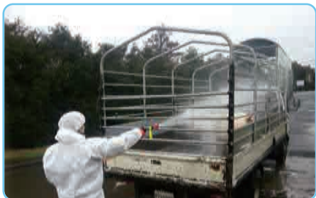
| 차량 외부 소독