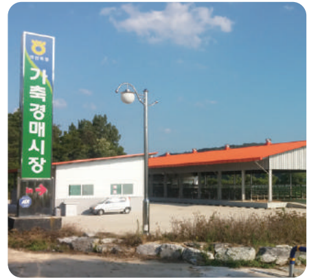
| 우시장 입구