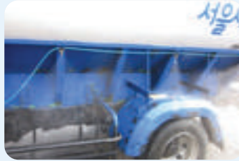
| 차량 외부 소독