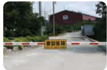
1 ② 출입구 통제