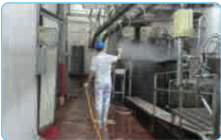
| 도축장 내부 소독