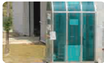
| 운전자 대인 소독