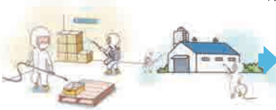
8 축산시설 출입자 전용신발· 위생복 착용