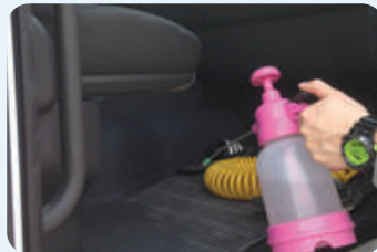
| 차량 내부 소독