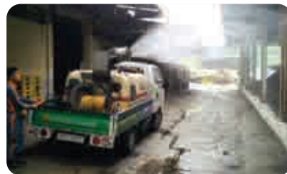
| 공장내부 소독