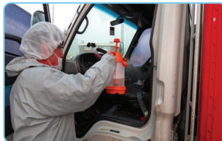
| 차량 내부 소독