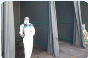
| 공장 내부 소독