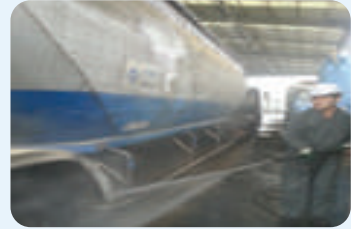
| 차량 외부 2차소독