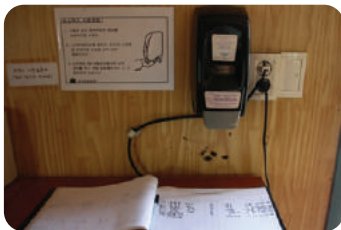
1 ① 외부인 방문 및 소독 기록