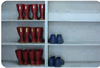
① 전용신발 교체