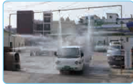
| 도축장 출입차량 소독