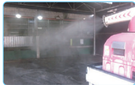
| 도축장 외부 소독