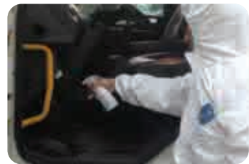
차량 내부 소독