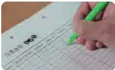
| 출입기록부 작성