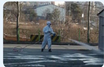
| 공장 내부 소독