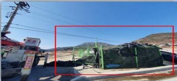
관리대상(폐비닐 재활용 집하장 등)