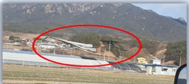
강풍에 의한 비닐 날림현상