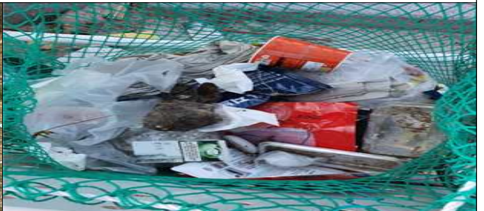
재활용품 분리수거함 내 일반쓰레기 배출