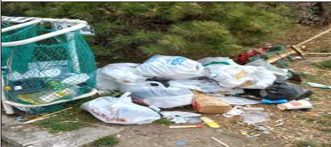
종량제 봉투 미사용