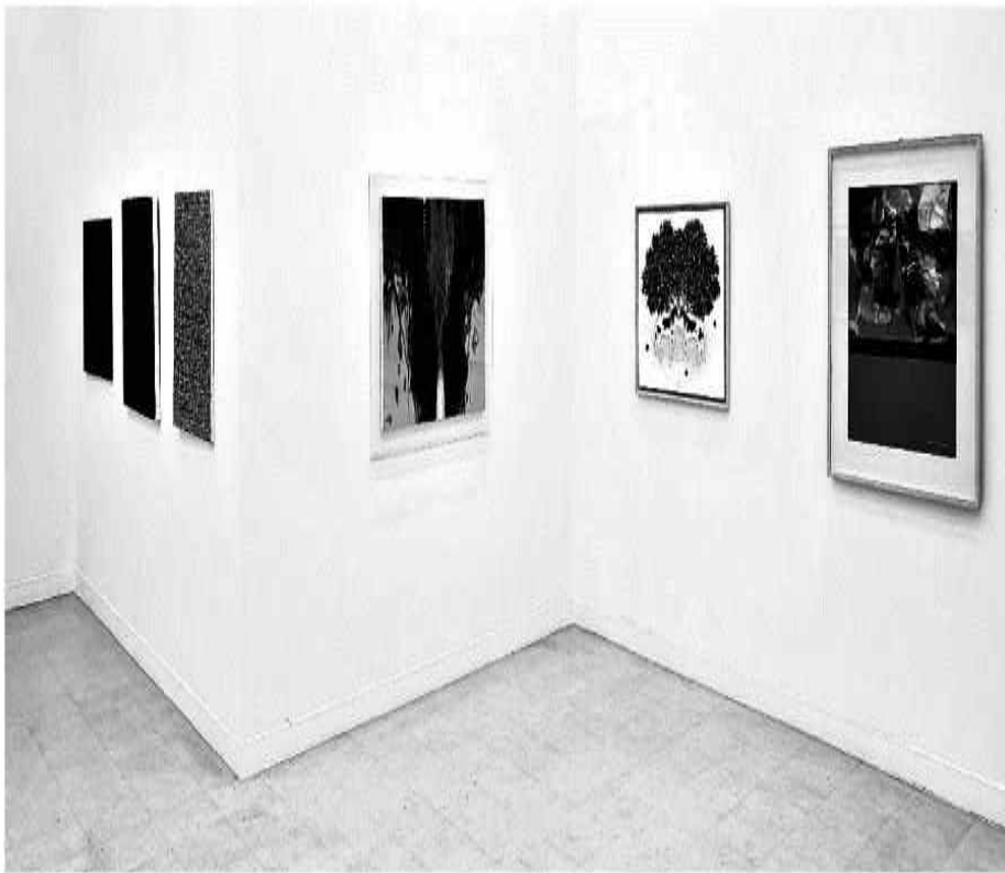
(재)거창문화재단은 6월 18일까지 거창문화센터 내 전시실에서 거창문화센터 재개관 기념 '중견 원로작가 20인 특별초대전'을 개최한다.

백 등 한국을 대표하는 중견 원로작가 20인의 다채로운 색감이 담긴 작품 40여 점이 전시되어 있다.