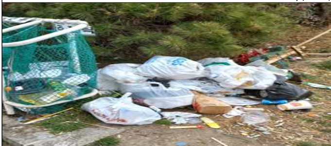
종량제 봉투 미사용