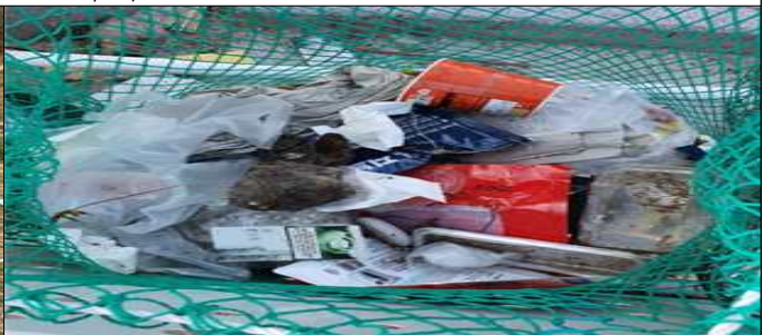
재활용품 분리수거함 내 일반쓰레기 배출