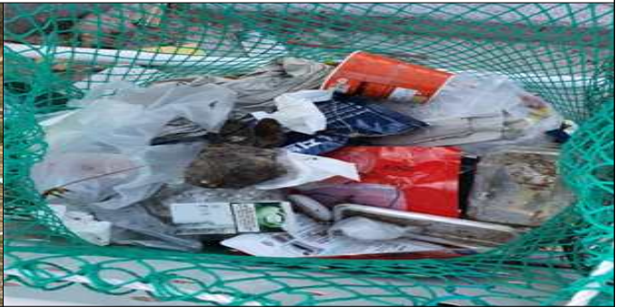
재활용품 분리수거함 내 일반쓰레기 배출