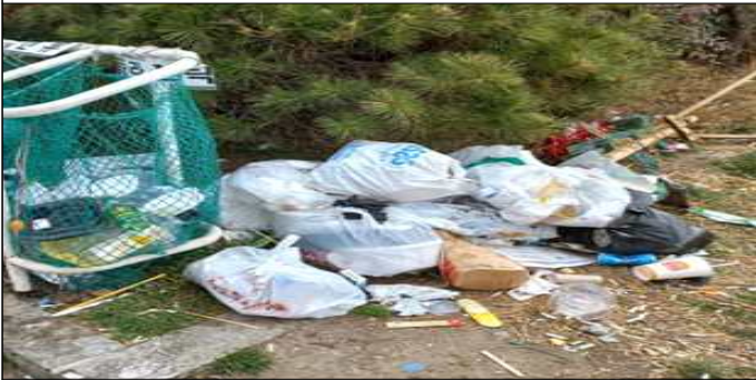
종량제 봉투 미사용