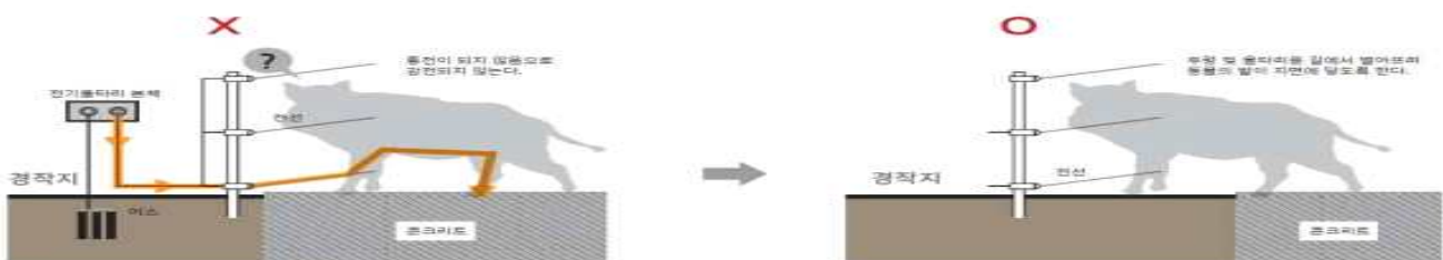
[그림 4-2] 전기울타리 바깥쪽이 콘크리트나 아스팔트로 포장되어 있는 경우