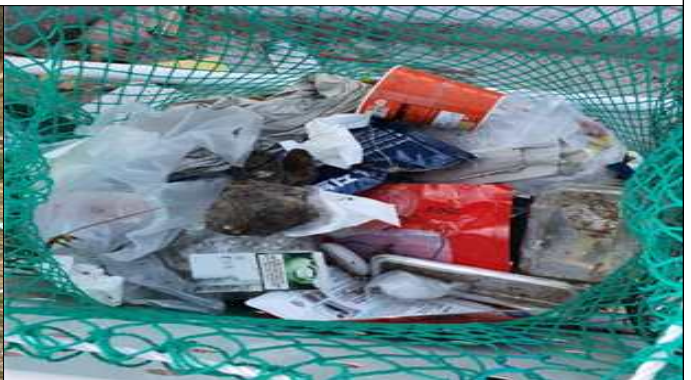
재활용품 분리수거함 내 일반쓰레기 배출