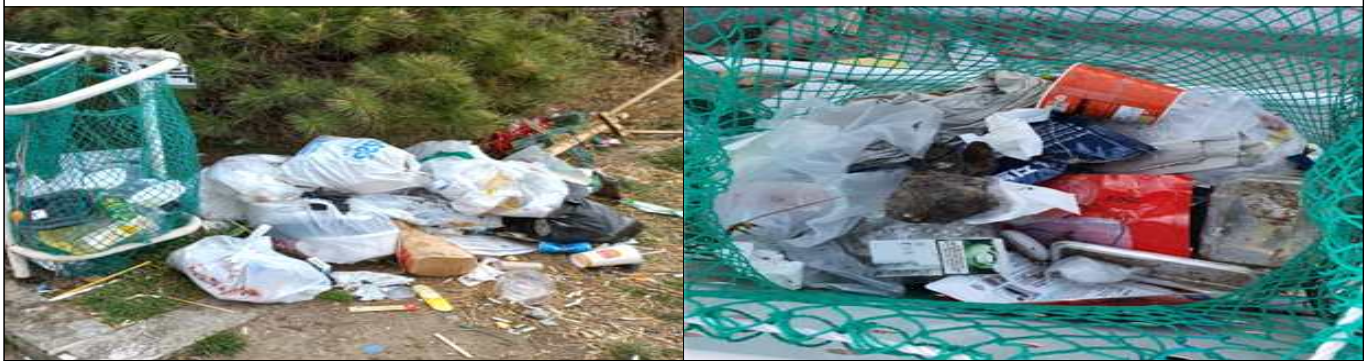
종량제 봉투 미사용