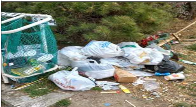
종량제 봉투 미사용