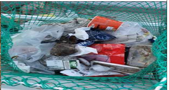
재활용품 분리수거함 내 일반쓰레기 배출