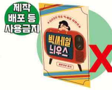
합성수지로 코팅된 1회용 광고선전물