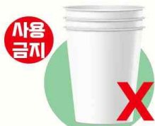
1회용 컵 (합성수지·금속박 등)