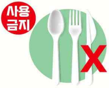
1회용 합성수지 수저·포크·ナイ플