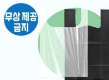
1회용 봉투 및 쇼핑백