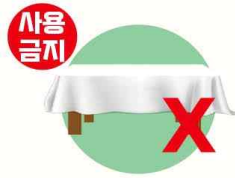
1회용 비닐식탁보 (생분해성수지제품 제외)