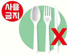
1회용 합성수지 수저·포크·ナイ플