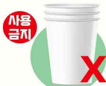
1회용 컵 (합성수지·금속박 등)