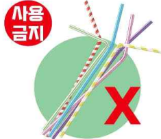
1회용 플라스틱 빨대 및 젓는 막대