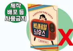
합성수지로 코팅된 1회용 광고선전물