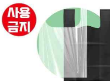
1회용 봉투 및 쇼핑백 (종합소매업 해당)