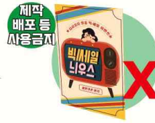
합성수지로 코팅된 1회용 광고선전물