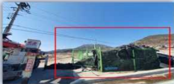
관리대상(폐비닐 재활용 집하장 등)