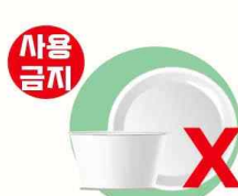
1회용 접시·용기 (종이, 합성수지·금속박 등)