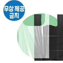
1회용 봉투 및 쇼핑백 (음식점 및 주점업만 해당, 제과점은 사용금지)