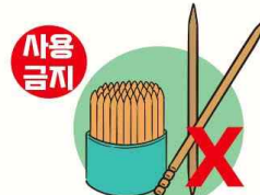
이쑤시개 (전분으로 제조한 것은 제외)