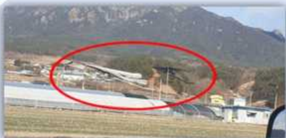
강풍에 의한 비닐 날림현상