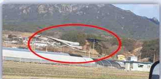
강풍에 의한 비닐 날림현상