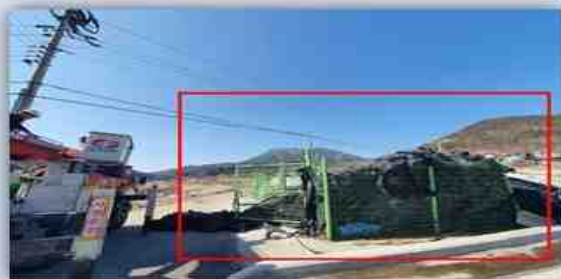
관리대상(폐비닐 재활용 집하장 등)