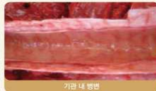
기관 내 병변