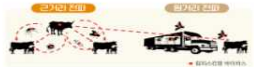
* 출처 : Lumpy Skin Disease - A Field Manual for Veterinarian FAO 2017