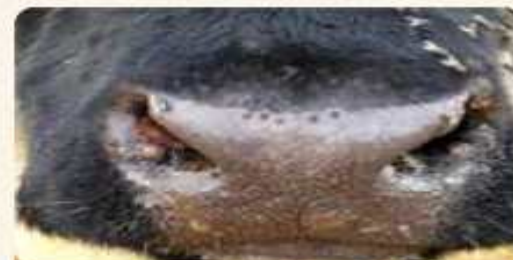
주둥이 및 입술의 궤양성 병변