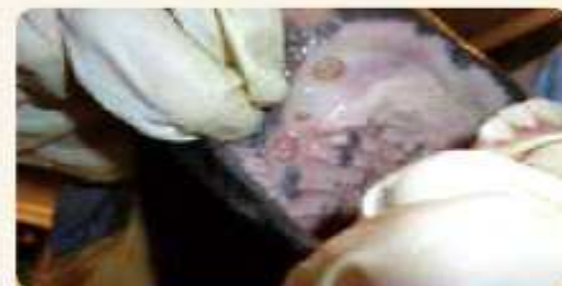
구강 내 궤양성 병변