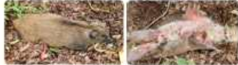
(전통적인 증상 : 피부가 붉은색으로 변함)

※ 산행중 무해한 냄새가 심하게 나면 주변에 폐사체가 있을 가능성이 높음