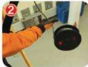
2 밖으로 로프를 놓는다.