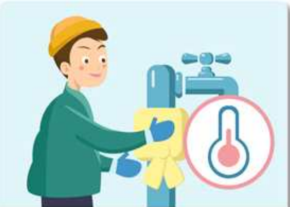
수도계량기, 보일러 배관 등은 현 옷 등으로 보온합니다.