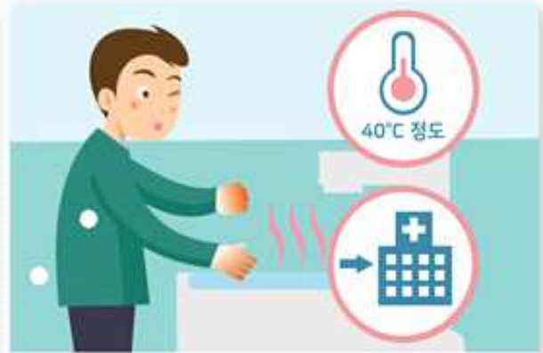
동상에 걸리면, 비비지 말고 따뜻한 물에 30분가량 담그고, 온도를 유지하며 즉시 병원으로 갑니다.