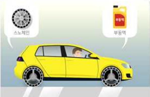
도리가 열 수 있으니 차에 스노체인 등 월동용품 준비하고, 부동액 등 자동차 점검을 합니다.