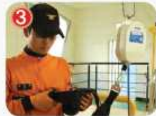
3 벨트를 겨드랑이 밑에 건 후, 벨트를 가슴에 확실히 조인다.