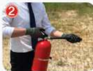
2 노즐이 화점을 향하게 하고 손잡이를 움켜쥐는다.