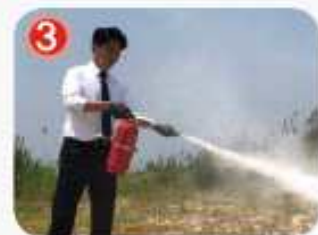
3 소화가 완료될 때까지 골고루 방시한다.

■ 휴대폰으로 QR코드를 스캔하면 소방시설 사용방법을 영상으로 볼 수 있습니다.