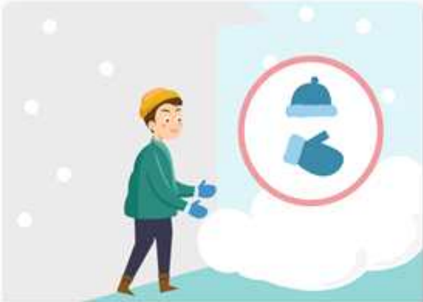
외출 시에는 동상에 걸리지 않도록 보온에 유의합니다.