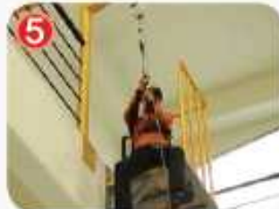
5 두 손으로 로프를 잡고 발부터 창 밖으로 내민다.