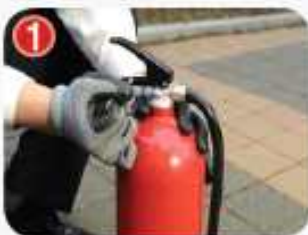
1 소화기를 바닥에 두고 안전핀을 뽑는다.