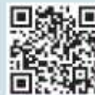
유도등 및 비상조명등