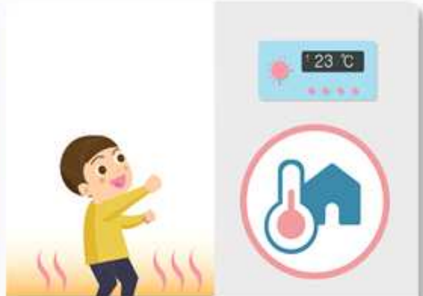
노약자, 영유아 등을 위해 난방과 온도관리에 유의합니다.