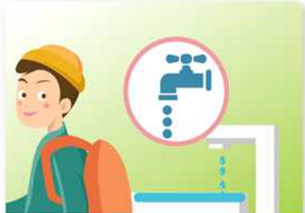
장기간 외출 시 온수를 약하게 틀어 동파를 방지합니다.