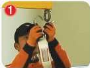
1 완강기 후크를 고리에 걸고 나사를 조인다.