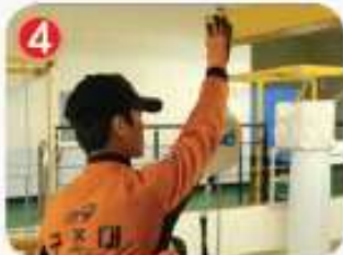
4 지지대를 창밖으로 향하게 한다.