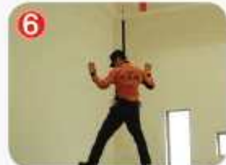
6 몸이 벽에 부딪히지 않도록 손으로 벽을 밀면서 내려온다.