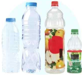
투명한 생수·음료수 병