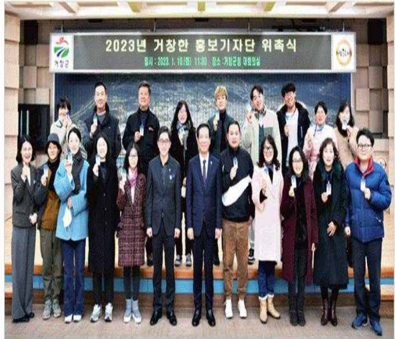
10일 거창군청 대회의실에서 진행된 '2023 거창한 홍보기자단 위촉식' 참여자들이 기념사진을 촬영하고 있다.

기자단은 앞으로 군정소식, 행사, 관광, 농특산물 등 거창을 구석구석 누비면서 다양하고 생동감 있는 소식을 사진과 영상으로 취재해 거창군 공식 블로그