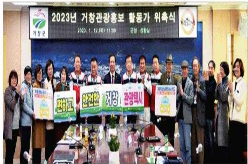
12일 ‘2023년 거창관광홍보 활동가 위촉식’ 참여자들이 기념사진을 촬영하고 있다.

운 여행으로 탈바꿈해 주는 거창 관광택시는 관외 주민등록된 관광객들을 대상으로 택시 이용요금 50%를 거창군에서 부담함에 따라 편안하고 안전한 여행 환경을 제공한다.