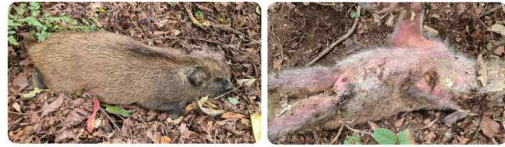
〈전형적인 증상 : 피부가 붉은색으로 변함〉

※ 산행중 부패한 냄새가 심하게 나면 주변에 폐사체가 있을 가능성이 높음