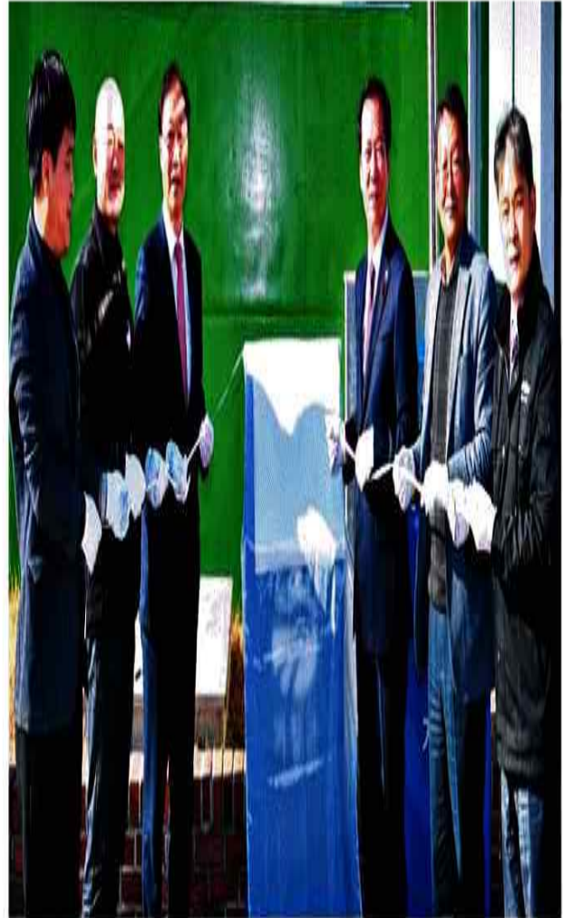
지난 10일 거창군이 소각시설 전국 최우수시설 인증현판 제막행사를 개최하고 있다.

군은 2019년 평가에서도 전국 최우 수상을 수상한 바 있으며, 2022년 평가 에서는 소각열을 활용한 에너지 활용 증대 노력과 편익시설 에너지 공급 및