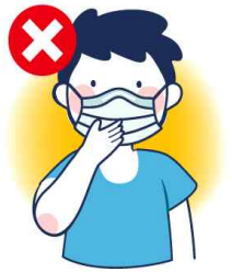
걸을 만지는 행위