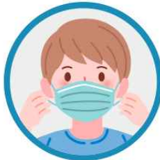
입과 코를 가리고, 틈이 없도록 착용