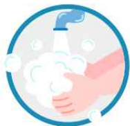
마스크 착용 전 깨끗이 손 씻기