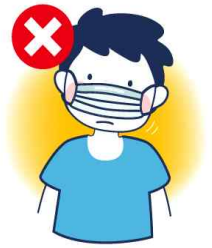
코만 가리는 착용