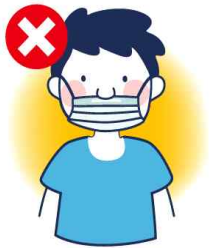
입만 가리는 착용