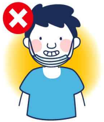
턱에 걸치는 착용