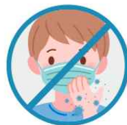
착용중 마스크 만지지 않기 만진 후 깨끗이 손씻기