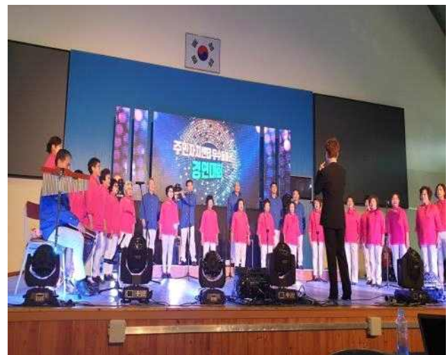
※ 유튜브에서 “2019년 우수 동아리 경연대회 수상작 소개”라고 검색하시면 만나볼 수 있습니다. (유튜브 채널명 : 제2회 경상남도 주민자치 박람회)

또한, 박람회 행사 중 “2019년도 우수 동아리 경연대회 수상작 소개” 시간에는 최우수상을 수상한 “주상愛 프렌즈”도 만나볼 수 있는데요, 주민자치 활성화를 위해 노력하고 있는 우리군 주민자치(위원)회의 활동들이 다양한 방면에서 두각을 나타내고 있어 자랑스럽습니다.