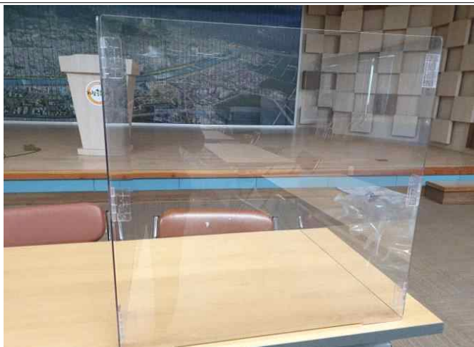
“ㄷ” 자형 접이식 가림막 25개