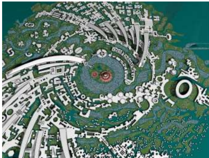
오로빌 국제도시 마스터 플랜