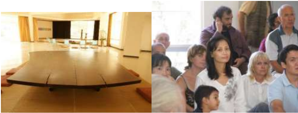
유너티 파빌런의 세계 평화 테이블 - 미국의 저명한 일본계 예술가가 전 세계 주요지역 4 곳에만 기증( 50 명이 둘러 앉을 수 있음)