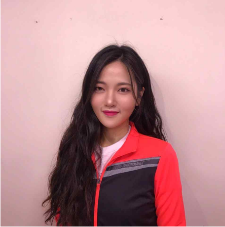
피트니스댄스 이 한 슬