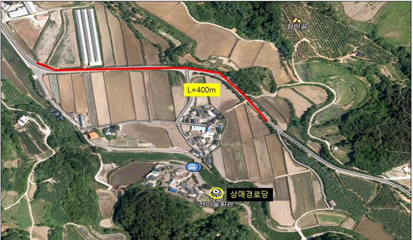
남상면 무촌리 831-20 ~ 무촌리 864-26(L=400m)