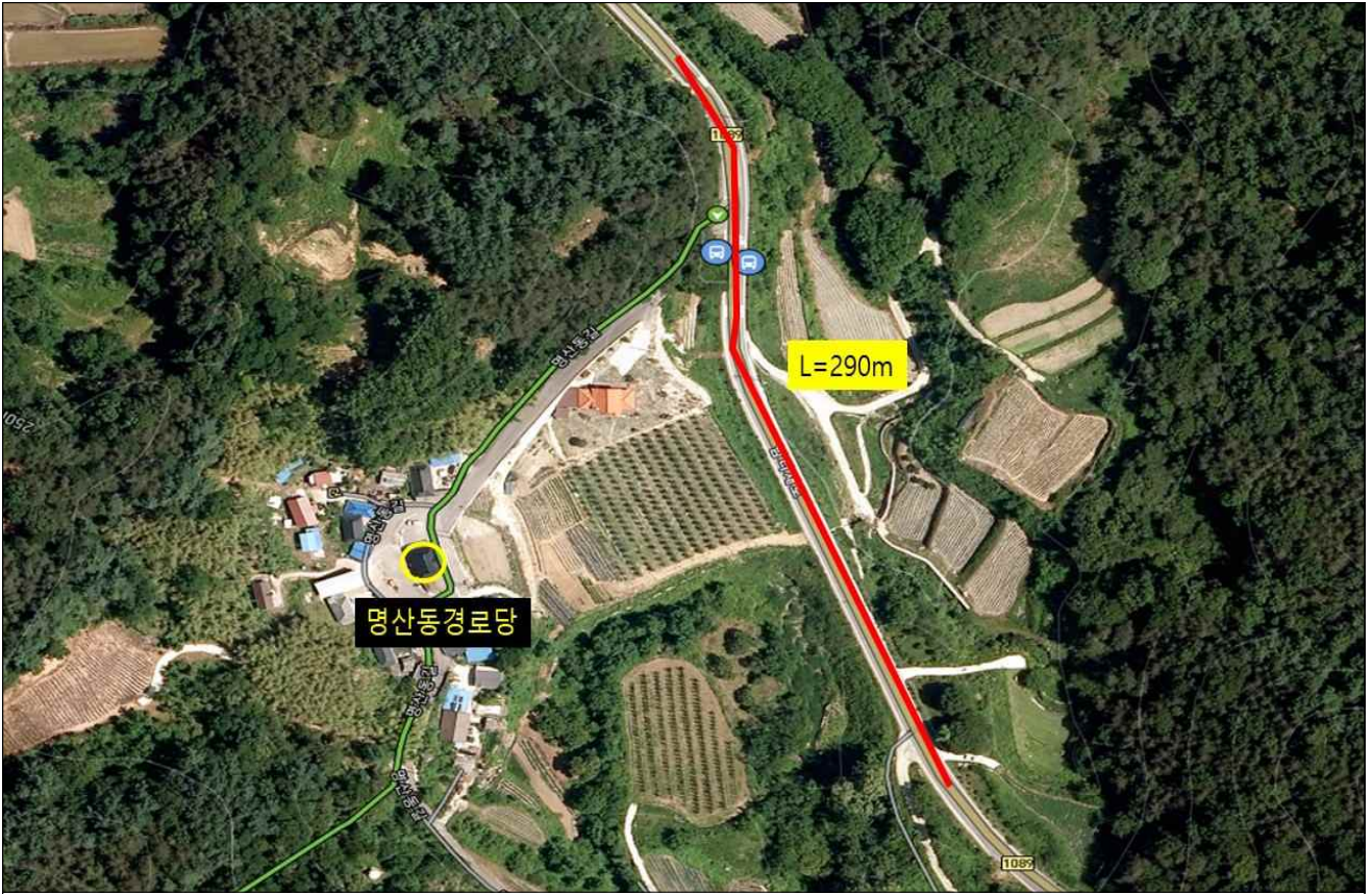
남상면 전척리 산79-1 ~ 전척리 144-12(L=290m)