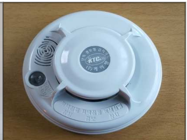
단독경보형 감지기 (약 1만원)