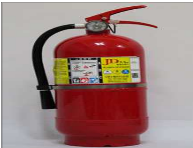
소화기 3.3Kg (약 2만원)

○ 모든 주택은 2017년 2월 4일까지 주택용 소방시설을 설치 완료해야합니다.