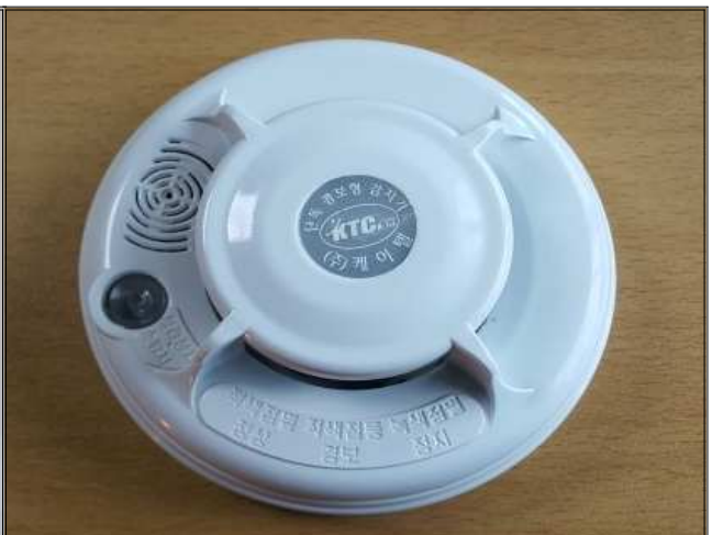
단독경보형 감지기 (약 1만원)