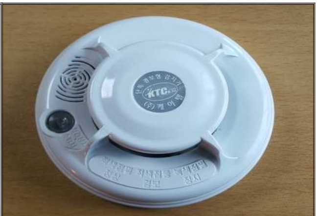
단독경보형 감지기 (약 1만원)