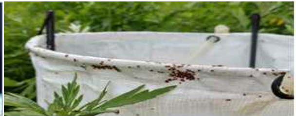
진드기 채집기에 붙어 있는 참진드기