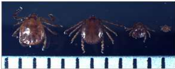
작은소피참진드기 (눈금한칸: 1mm) 암컷, 수컷, 약충, 유충 순서