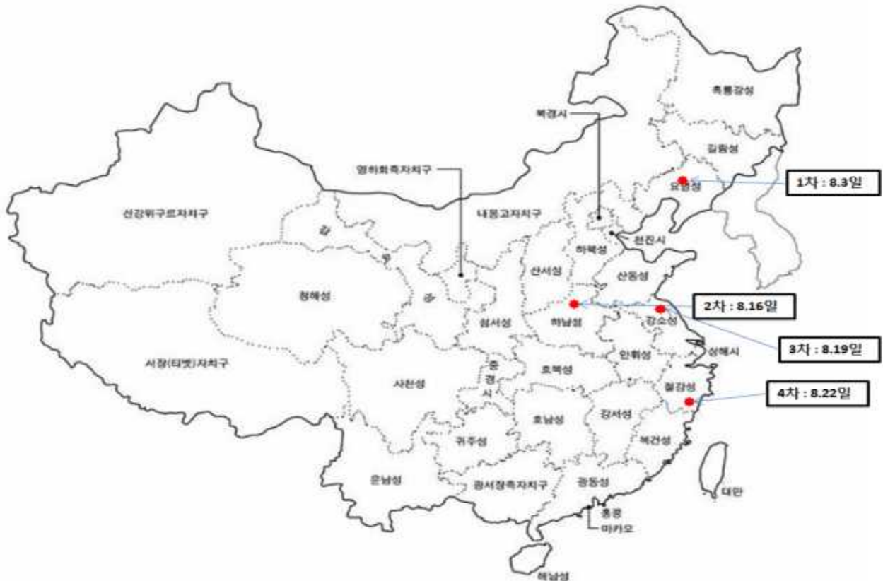
< 발생지도 >