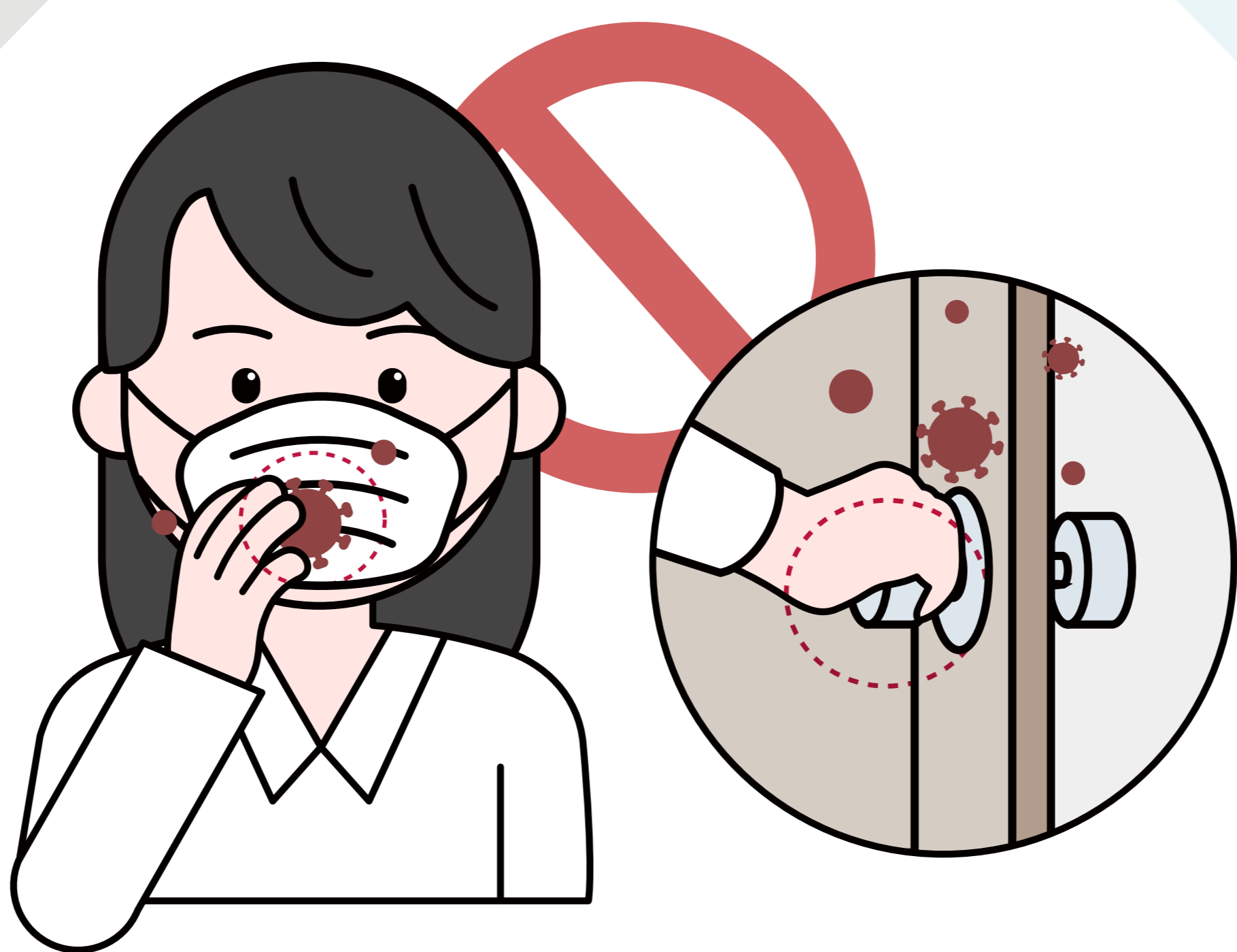
3 마스크 겉면을 만지는 행위