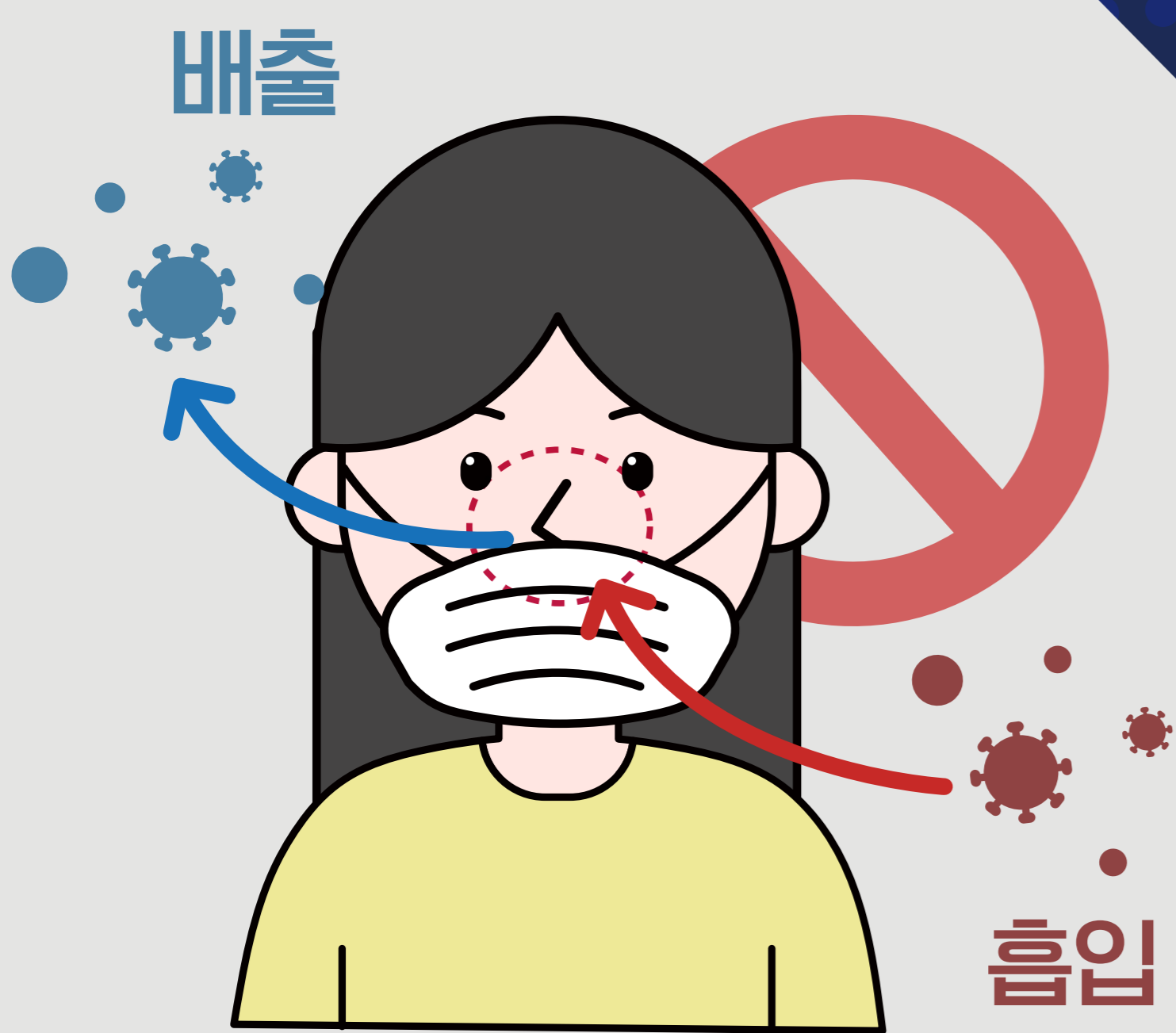
1 코가 노출되는 마스크 착용