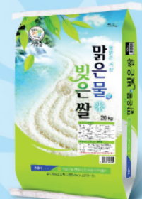
밥맛이 거창합니다 공용·추정(아미노산) 3량·1kg, 4kg, 10kg, 20kg 특정·농가계약(4/5)·재배업 표준화