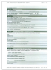
FDA 시설 등록