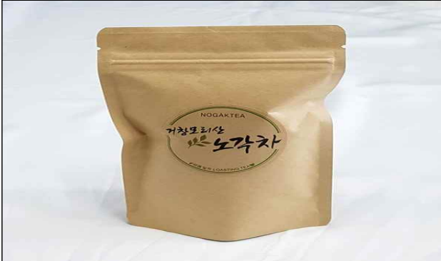
노각차 농업법인 모리(권영익)/ '17년도 - 노각나무 추출물을 이용한 건강차 개발 - 판매실적(300백만원)/삼양산유통센터, 백화점