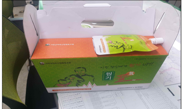
원기콜 거창군 약초협동조합(백용인)/'17년도 - 생맥산(보리, 맥문동 등)활용, 건강 숙취음료 - 판매실적(10백만원)