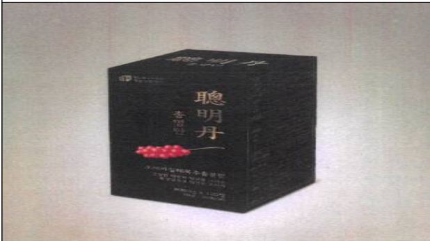
총명단 향노화식약자원영농조합(이공순)/'18년도 - 오미자 추출물을 활용한 건강식품 개발 - 식약처 등 정부 공모예정