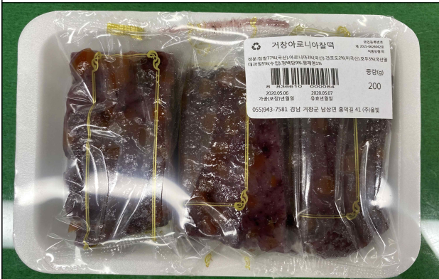
거창아로니아 찰떡/거창사과설기/거창딸기설기 (주)울빛(오유순)/'19년도 - 거창사과, 아로니아를 활용한 향노화 떡 개발 - '20년 하반기 출시예정