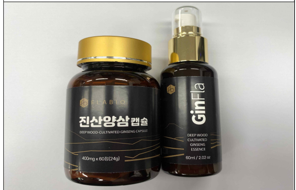
플라바이오 진산양삼캡슐/플라바이오 진플라 링클 도린네이처(권륜희)/'19년도 - 산양삼 약모밀 사과 등을 활용한 향노화식품 및 화장품 개발 - '21년 출시예정(코로나19로 인한 품목제조보고 지연)