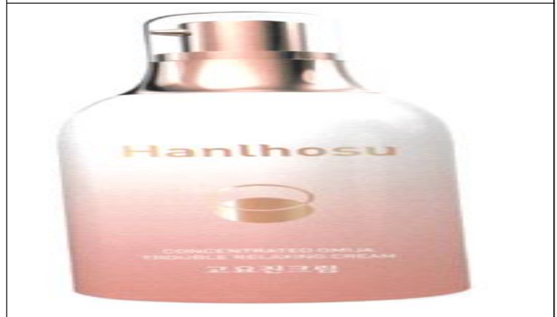
고요진 바디스크림, 여성청결제 (주)하늘호수(서미자)/'18년도 - 오미자 추출물을 이용한 화장품 개발 - 판매금액(100백만원), 하늘호수 매장, 온라인