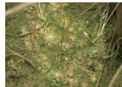
IRG 출현 상태