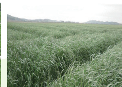
수확 시 생육전경