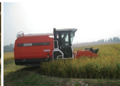
콤바인으로 벼 수확