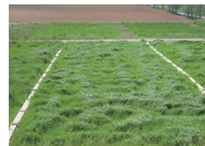
월동 후 생육상태