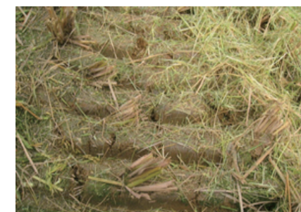
벼 수확 후 상태