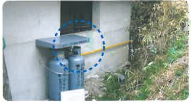
배관 및 용기차양 설치