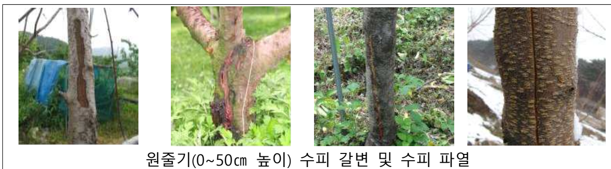
원줄기(0~50cm 높이) 수피 갈변 및 수피 파열