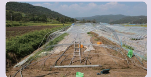
[일반 피해 하우스]