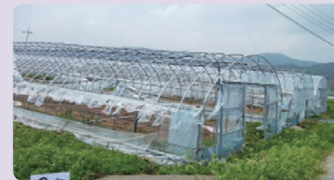
[비닐 사전 제거 하우스]