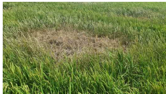
벼멸구 집중고사 피해