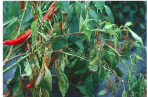
고추 역병 피해 증상