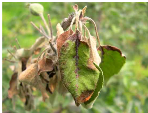
과수화상병 병징: (좌)배, (우)사과

➡ 약제선택은 농약정보서비스( http://pis.rda.go.kr ), 작물보호제 지침서를 참고하시고 관할 농업기술센터 또는 농업기술원에 문의하세요.