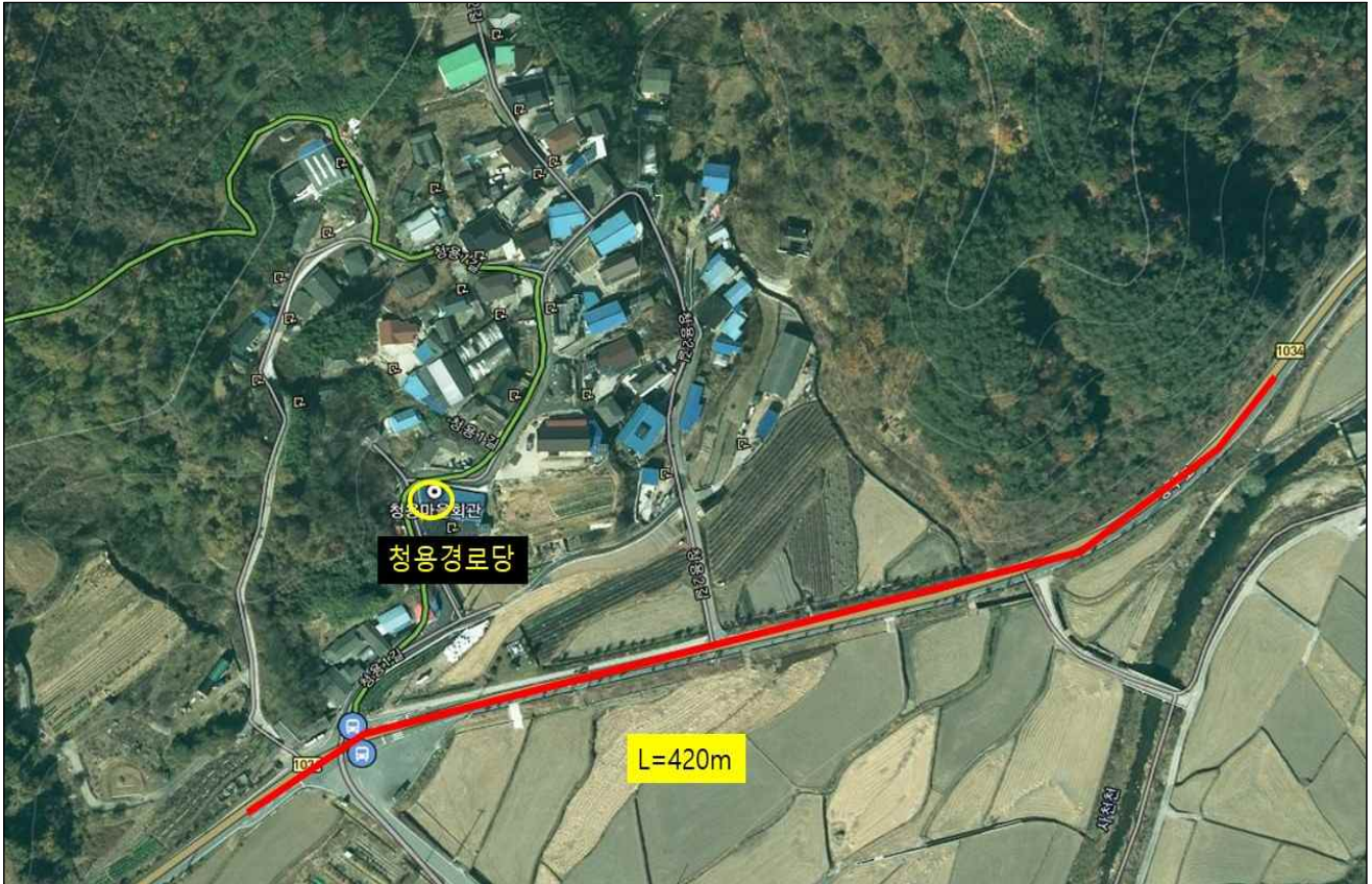
신원면 청수리 318-2 ~ 청수리 104-2 (L=420m)