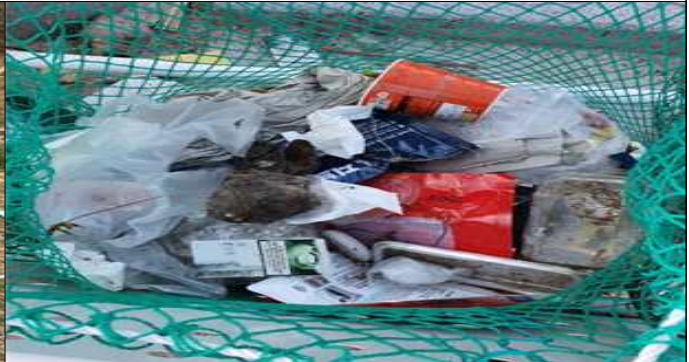
재활용품 분리수거함 내 일반쓰레기 배출