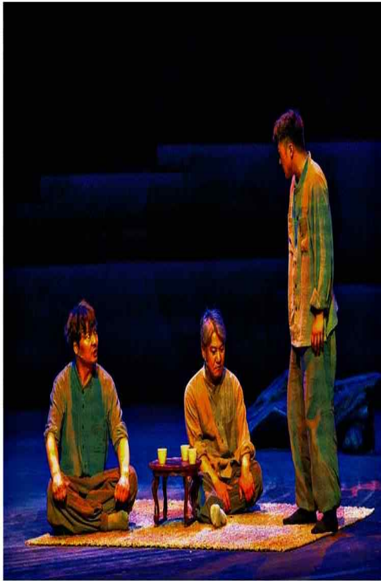
선원에서 수행중인 세 남자의 웃음과 눈물을 통해 '인생은 고행'이라는 삶의 진정한 의미를 찾는 여정을 그려낸 도립극단의 '눈물지니 웃음피고'.

'눈물지니 웃음피고'는 산속 선원에서 수행 중인 세 남자의 웃음과 눈물을 통해 인생은 고행이라는 삶의 진정한