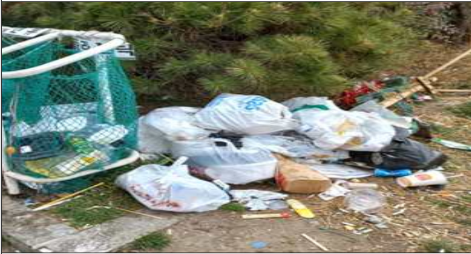
종량제 봉투 미사용