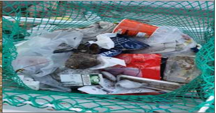
재활용품 분리수거함 내 일반쓰레기 배출