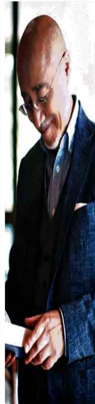
뉴에이지 음악의 거장 피아니스트 유키 구라모토. /크레디타