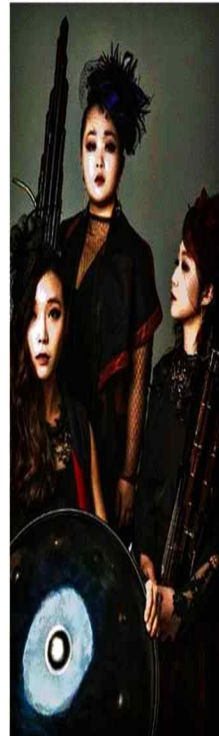
아름다운 국악 선율로 따뜻한 감동을 선사할 국악창작그룹 뮤르. /뮤르

한 의미를 찾는 여정을 그려낸 작품으로 관객들로 하여금 삶을 되돌아보고 인생에 대해 생각할 수 있는 무대를 선사할 예정이다며 예매는 다음 달 6일 금요일 오전 9시부터 가능하다.