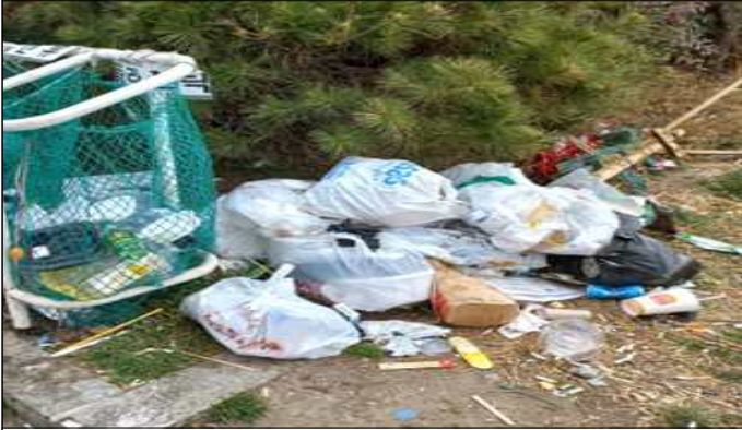
종량제 봉투 미사용