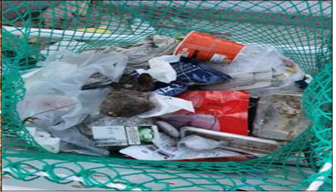
재활용품 분리수거함 내 일반쓰레기 배출