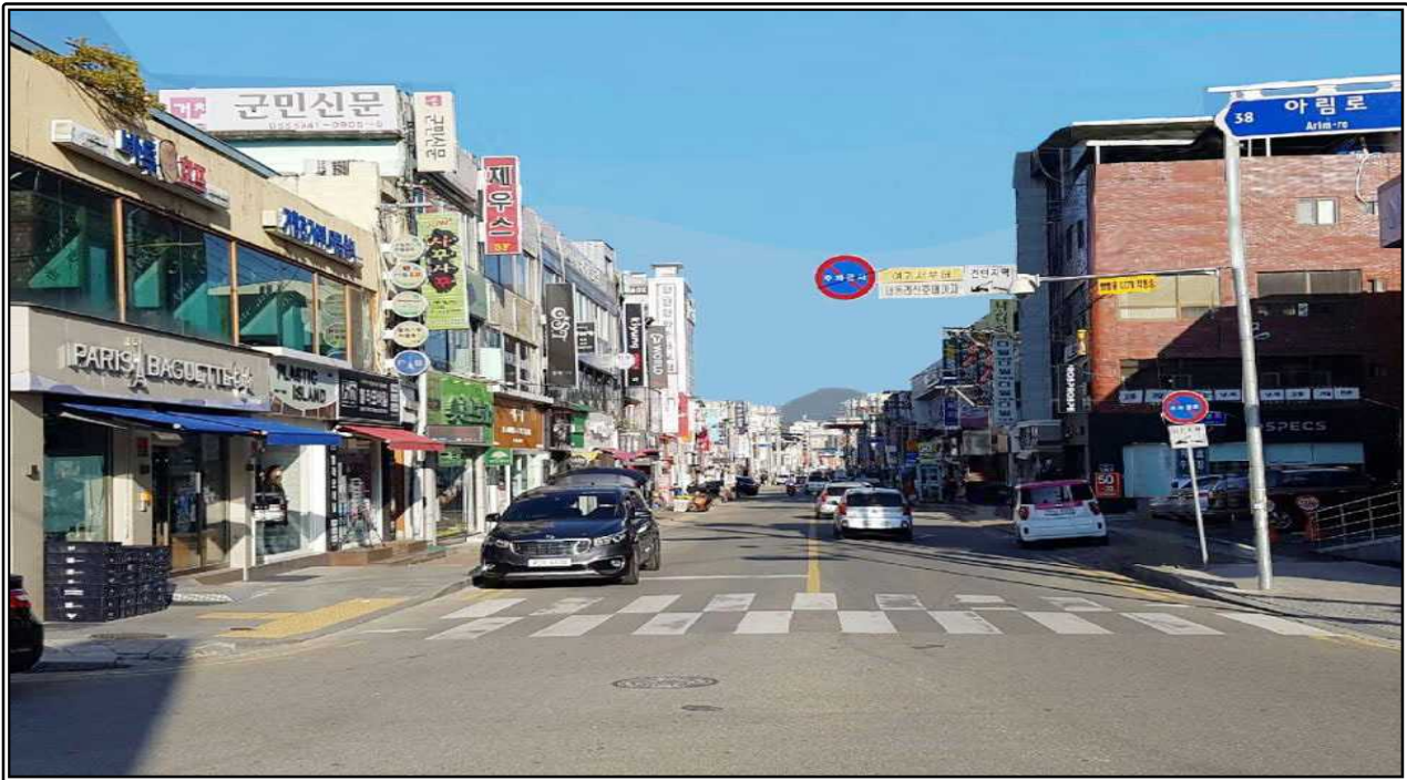
< 지중화 사업 후 >