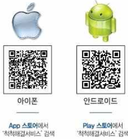
아이폰 App 스토어에서 '적척해결서비스' 검색 안드로이드 Play 스토어에서 '적척해결서비스' 검색

국토교통부 KICT 한국건설기술연구원 국토교통부 문의처 : 044-201-3916 한국건설기술연구원 문의처 : 031-995-0987