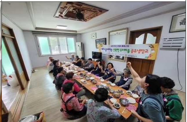
우리마을 공유냉장고 활동모습