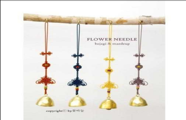
3차 : 풍경 만들기