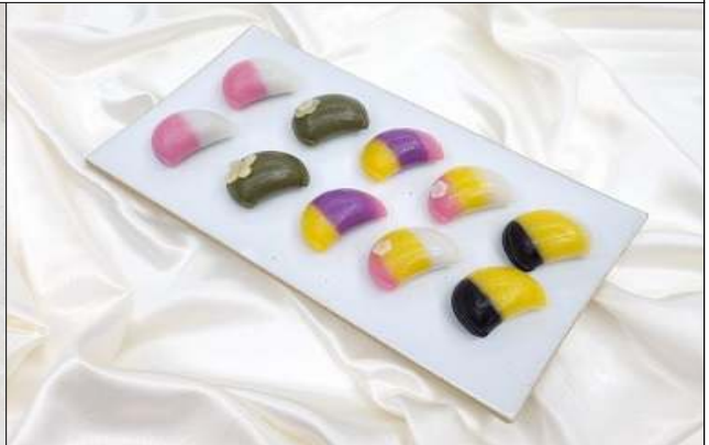
2차 : 바람떡 만들기