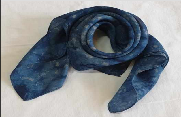
1차 : 인견스카프 쪽염색