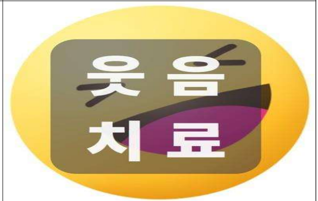
4차 : 웃음치료