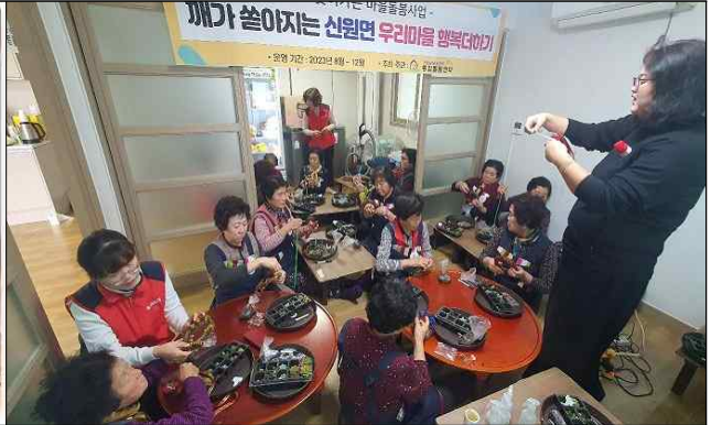
우리마을 행복 더하기 활동모습